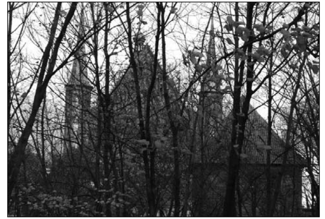
Blick vom vermuteten Standort des Denkmals auf die Kathedrale. Man vergleiche dieses Foto mit Bild 3.