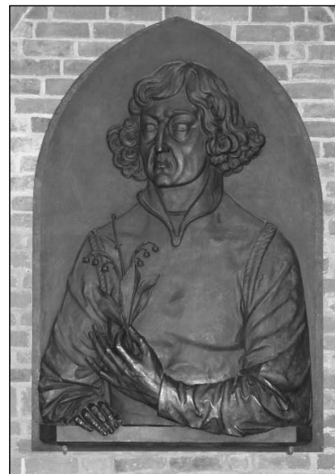
Links: Das Relief am Copernicus-Denkmal. Es befindet sich heute (ohne Schriftplatte) im Nicolaus-Copernicus-Museum neben dem Dom. Es ist wohl das einzige Fragment, das die Zeiten überdauert hat.