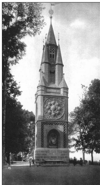
Das Copernicus-Denkmal von 1909 (aus: Dittrich, vor S. 483). Die abgebildeten Personen vermitteln einen Eindruck von der Größe dieses Bauwerks.

Oberhalb dieser Darstellung gab es ein weiteres Relief 5 von Seitz, das – in Kupfer getrieben – manchmal »Planetarium« genannt wurde: Acht gleich große Kreise (Halbkugeln?) und ein größerer Kreis zeigten die damals bekannten Planeten und die Sonne im Zentrum – so, wie es der Astronom gelehrt hatte. Die Himmelskörper trugen neben ihrem Namen die astronomischen