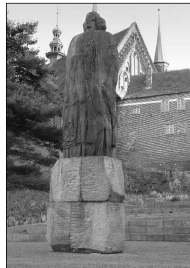
Rechts: Das Copernicus-Standbild von 1973.

wicz-Pilska (Frombork) für die bereitwillig erteilten Auskünfte.